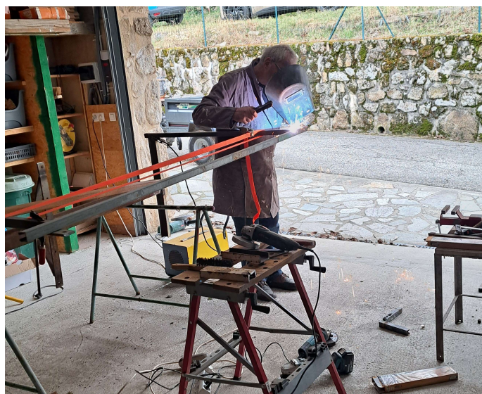
Réalisation de la passerelle en atelier